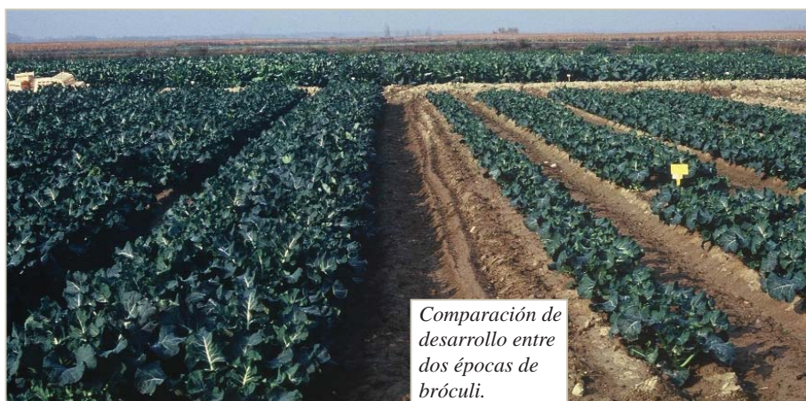
Comparación de desarrollo entre dos épocas de brócoli.

El periodo de recolección se extendió de mitad de octubre a mitad de diciembre.