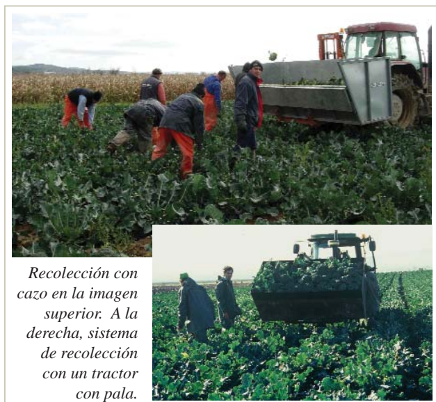
Recolección con cazo en la imagen superior. A la derecha, sistema de recolección con un tractor con pala.