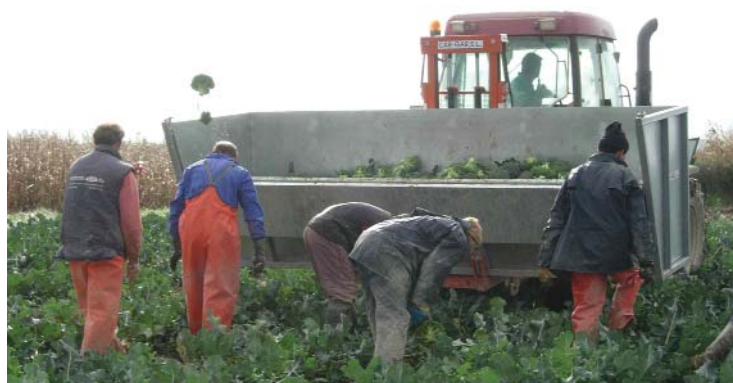
Recolección con cazo acoplado al tractor.

dieciocho variedades con escasas diferencias de producción entre ellas, de 16 a 18 t/ha, en el que se incluyen Chevalier, Belstar, Partenón, Everisa, Serydan, Lord, Montecarlo, etc. Más alejado se encuentra un pequeño grupo de seis variedades, con una producción entre 14 y 16 t/ha y por último SSC-1840 con 13,60 t/ha y Jonas con 8,35 t/ha.