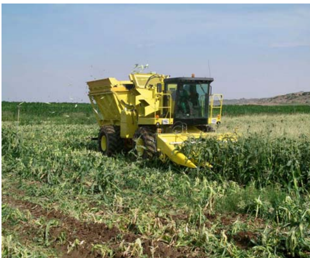
Cosechadora de seis filas.

El maíz dulce está listo para cosecharse aproximadamente 15 a 23 días después de la fecha que emergen al menos 50% de las sedas. Este momento de recolección suele coincidir con: