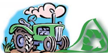
Cuadro 2.- Explotaciones en Tierra Estella