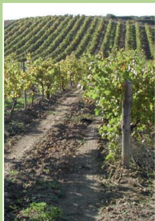
Consumo energético en Eq.litros gasoil /hectáreas

Por otra parte, y basándonos en los análisis realizados sobre las explotaciones, pretendíamos poner en marcha planes de ahorro y eficiencia energética con los agricultores y ganaderos que les permitieran mejorar los primeros resultados evaluados.