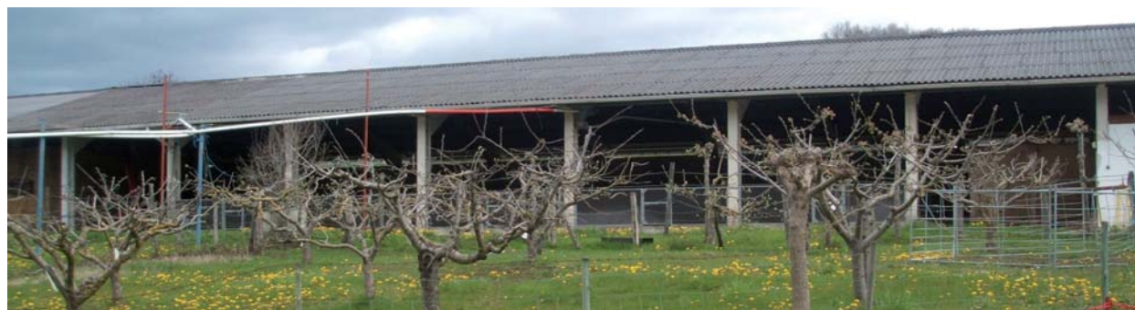
Nave de ovino del Centro de Inseminación Artificial de Oskotz (Navarra)

El objetivo actual es seguir trabajando por la mejora del sector ganadero buscando innovaciones y seguir manteniéndonos como empresa referente en el sector.