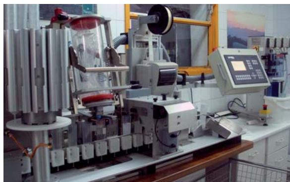
Envasado de semen de porcino.