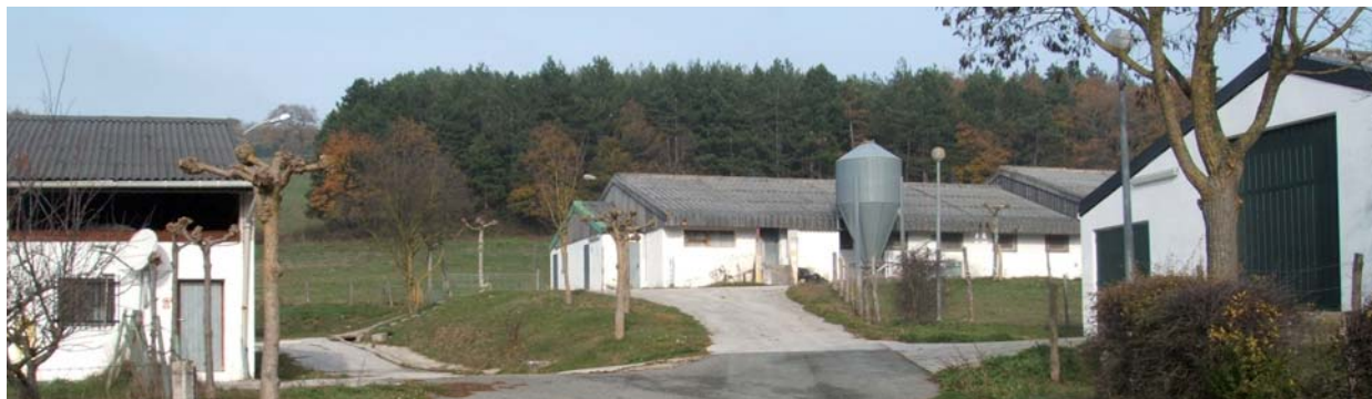
El Centro de Inseminación Artificial de Oskotz funciona desde 1987 y forma parte de los servicios de INTIA.